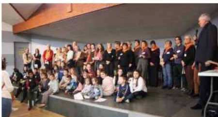
Marraine, invités, lauréats et bénévoles ont été félicités par le maire lors de la proclamation du palmarès 2022. G. L.

À l'heure du bilan, auteurs et invités se déclarent unanimement épatés par l'accueil, l'organisation, la gentillesse, l'implica-