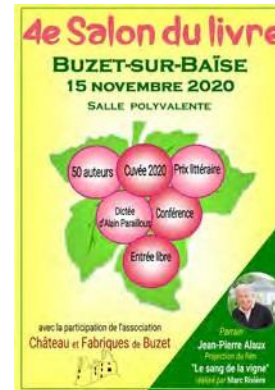
annulé cause COVID