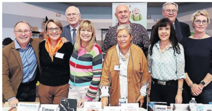
Le 6e salon du livre s'est achevé dans une ambiance amicale.