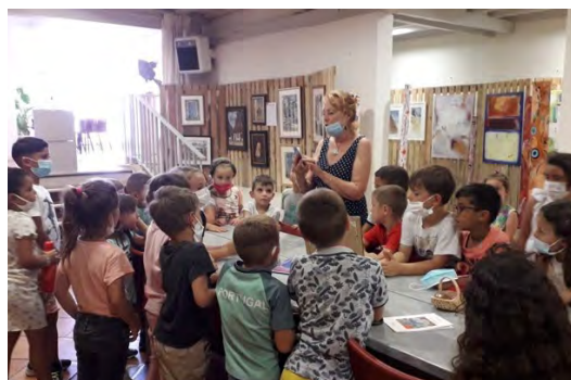
La peinture expliquée aux enfants