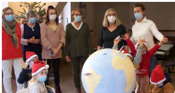
L'atelier de Noël et la planète de demain vue par les enfants

Le renouvellement régulier des livres et des mallettes à thèmes, l'accueil et l'animation des classes (depuis le RAM jusqu'au CM2), la poursuite du club d'anglais, tout cela a permis une bonne fréquentation de la bibliothèque. Pour terminer l'année, les enfants ont imaginé la planète de demain, activité ludique qui leur a été proposée lors de l'atelier de Noël.