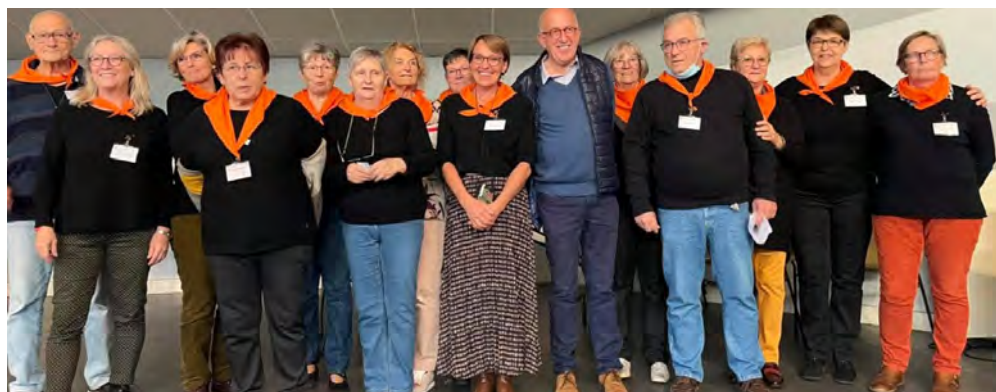
L'équipe des bénévoles du Salon du Livre

Toute l'équipe a confiance dans l'arrivée de jours meilleurs et vous souhaite, pour vous et vos proches, le meilleur de cette nouvelle année.